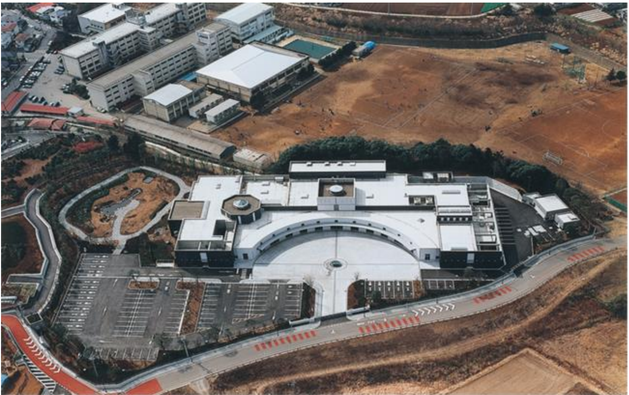
ウイングホール柏斎場全景