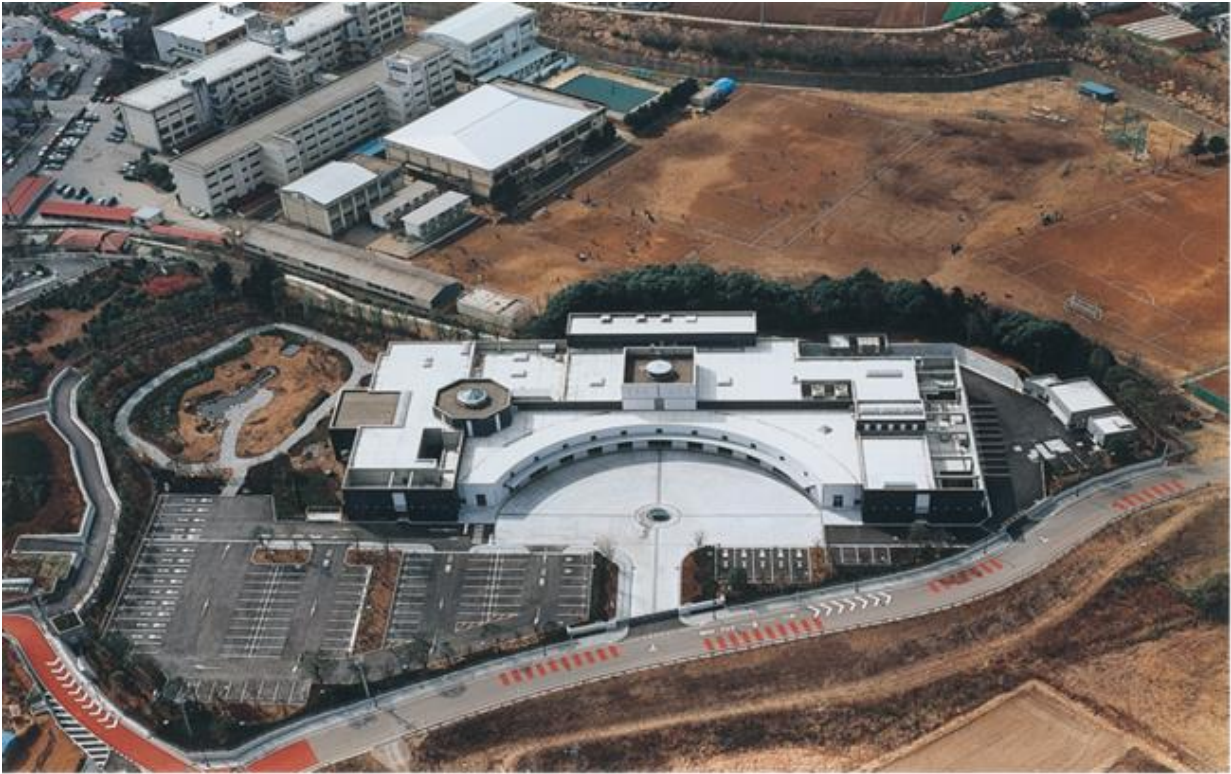
ウイングホール柏斎場全景