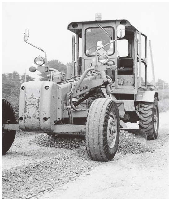
モーターグレーダー

その後，急激な人口の増加による市街化地域の拡大に伴い延伸する道路を，モーターグレーダーの入替え等を行いながら整備を進めていき，計画どおり区域内の主要道路のほぼ全域が整った昭和50年3月に事業を終了することとなった。