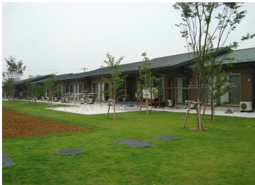
みどりの家 壱番館・弐番館